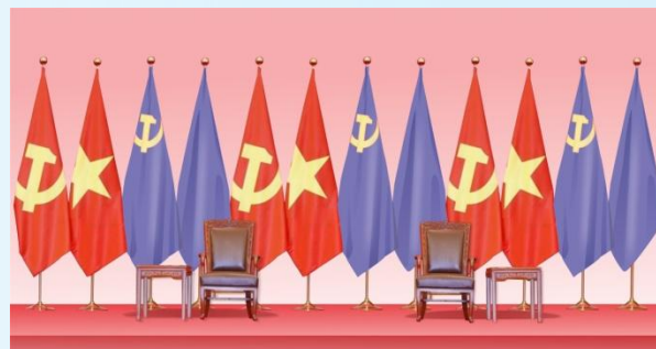
Hình 23b - Hình thức trực tiếp (2 cờ màu tím là minh họa cờ Đảng và Quốc kỳ nước khách)