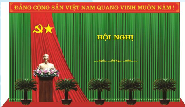
Hình 5b (cờ xếp chéo đơn)