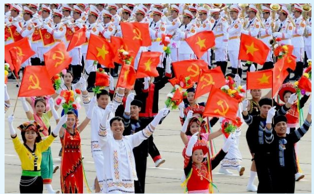
Hình 24d (vẫy bằng tay)