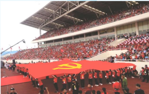
Hình 25a (rước cờ vai)