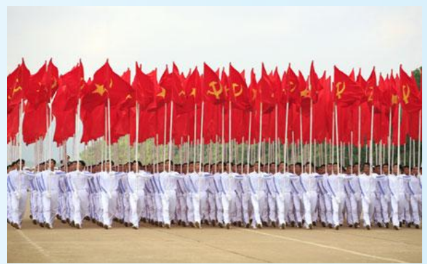
Hình 25b (rước theo hàng)