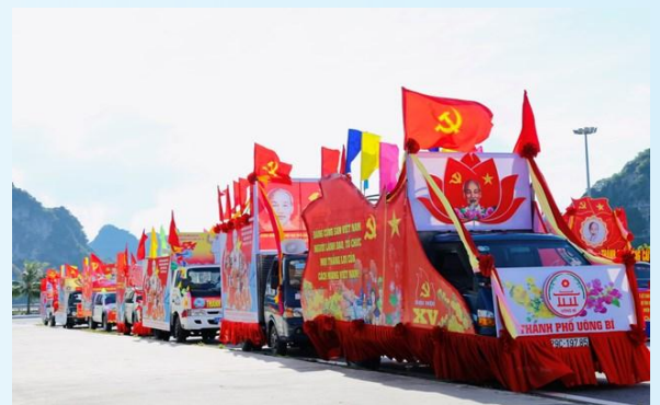
Hình 25d (rước bằng xe)