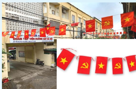
Hình 16b (cờ dây)