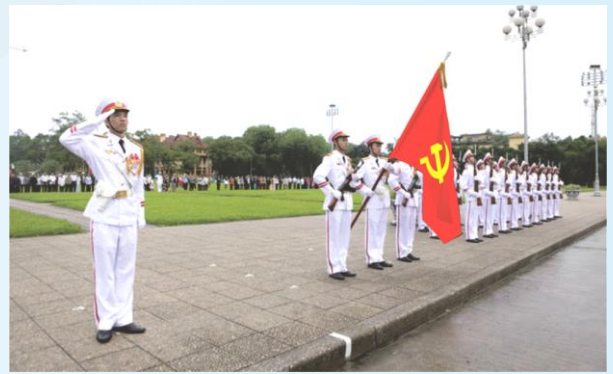
Hình 24b (giương cờ)