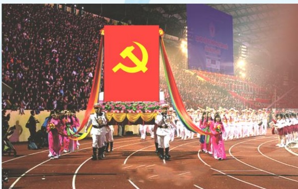
Hình 25c (rước trên kiệu)