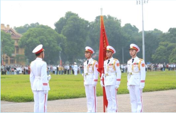
Hình 24a (cầm cờ)