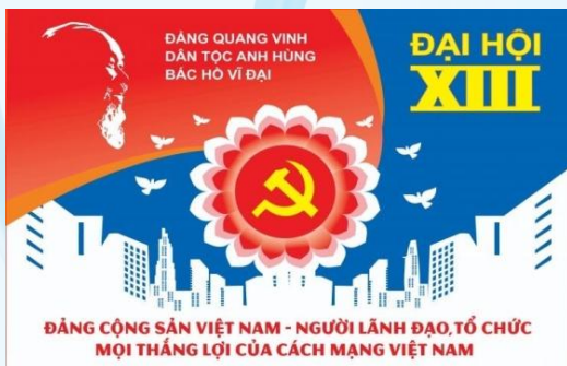
Hình 32c (panô tuyên truyền)