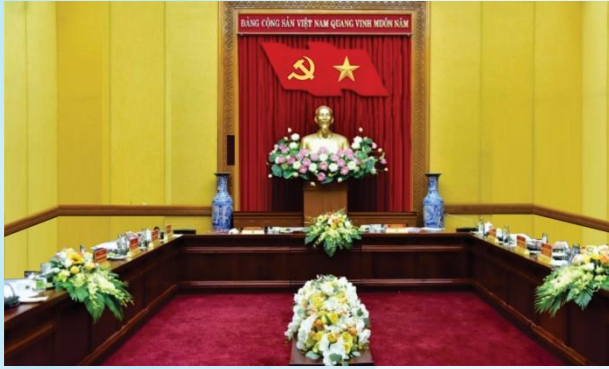
Hình 4b (kích thước hội trường nhỏ)