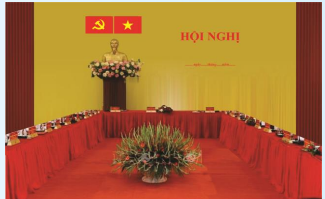
Hình 3a (cờ không tạo sóng)