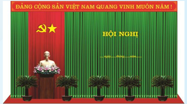
Hình 5a (cờ xếp dọc)