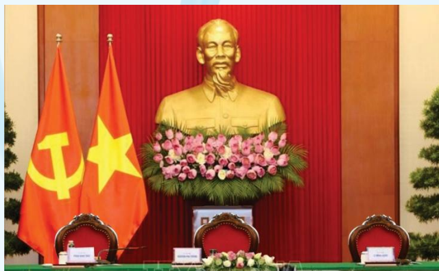
Hình 23a - Hình thức trực tuyến

Điều 12. Nơi tổ chức các hoạt động đối ngoại đảng, ngoại giao nhà nước