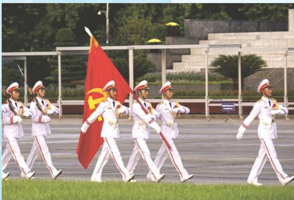
Hình 24c (vác cờ)