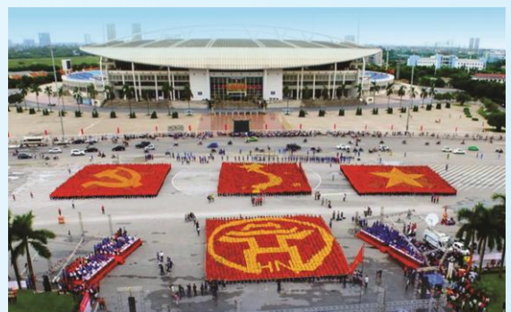
Hình 33 (xếp bằng người)