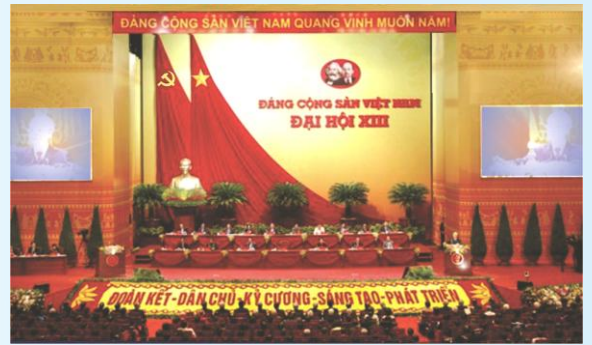
Hình 5c (cờ xếp chéo đôi)